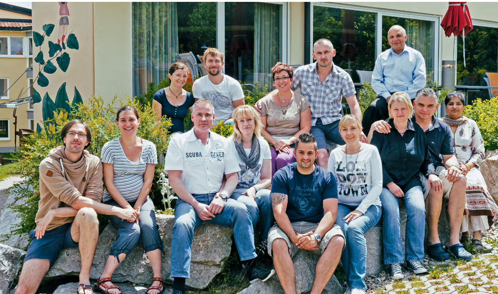
Die Teilnehmer einer Rehabilitation für Verwaiste Familien an der Nachsorgeklinik Tannheim.