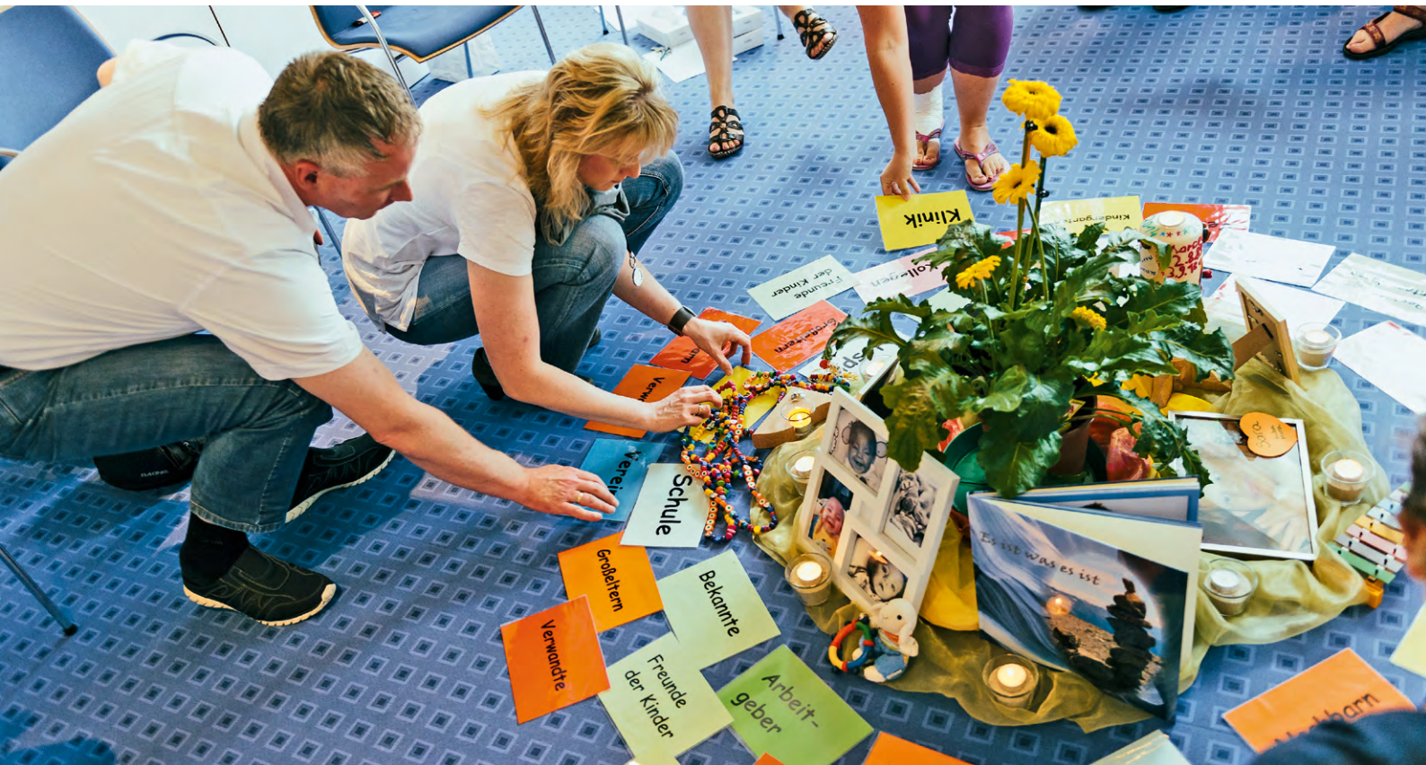
Eltern formulieren im Rahmen der Gruppentherapie, wer ihnen in ihrer Trauer zur Seite steht.